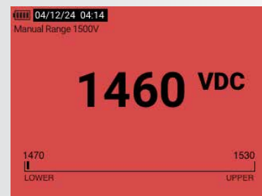
Limitní měřič – mimo rozsah